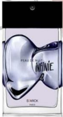
Peau de nuit Infinie de STARCK PARIS