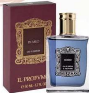
Romeo IL PROFVMO il Profvmo

JOHN VARVATOS , la colección capsula creada en colaboración con Nick Jonas, galardonado cantante y actor reconocido a nivel mundial. Un frasco de perfume está tintado con una laca azul perlada simulando el cielo de medianoche para producir un acabado clásico, pero a su vez atrevido. El tapón de tuerca hexagonal y la placa grabada con JvXNJ añaden un guiño al rock-n-roll, una estética profundamente arraigada en la marca John Varvatos.