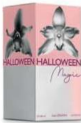
Halloween Magic JESUS DEL POZO