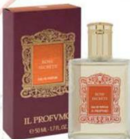
Rose Secrete IL PROFVMO