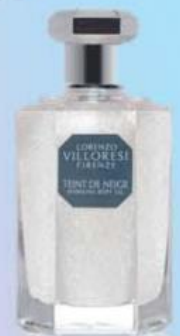
LORENZO VILLORESI Body gel