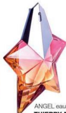
ANGEL eau croisiere THIERRY MULLER