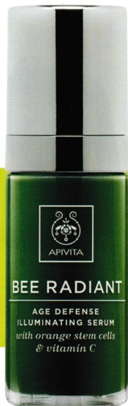
PARA PIELS DAÑADAS. Iluminador defensa antiedad, con células madre de tallo de naranja y vitamina C. Apivita. Bee Radiant Serum. 30 ml: 48 €