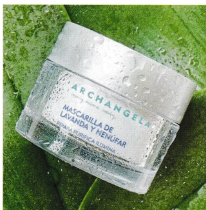
CURA REPARADORA. Proporciona descanso y luz inmediata a las pieles apagadas. Archangela. Mascarilla de lavanda y nenúfar. 50 ml: 39 €