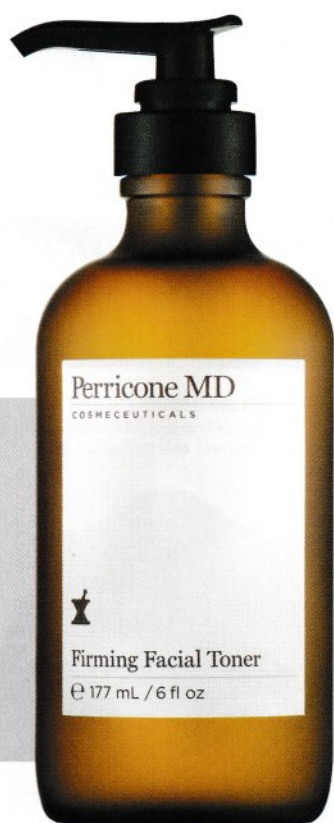
PONER ORDEN. Tónico que no reseca formulado para restablecer el pH natural de la piel. Reafirmante. Perricone. Firming Facial Toner. 177 ml: 45 €