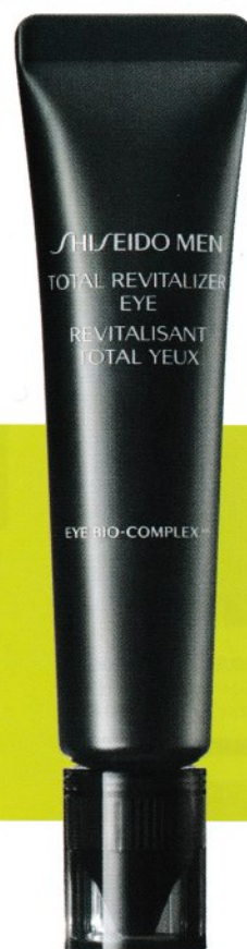
PLANCHA OJOS. Inspirado en las inyecciones de ácido hialurónico. Shiseido Men. Total Revitalizer Eye. 15 ml: 64 €