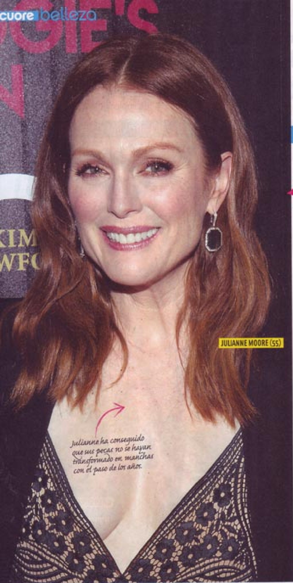
JULIANNE MOORE (55)

Julianne ha conseguido que sus pecas no se hayan transformado en manchas con el paso de los años.