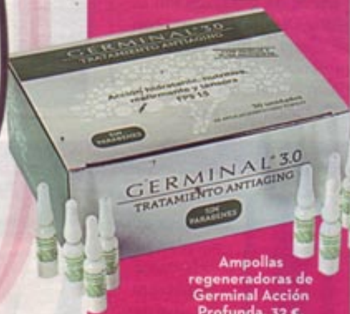
Ampollas regeneradoras de Germinal Acción Profunda. 32 €.