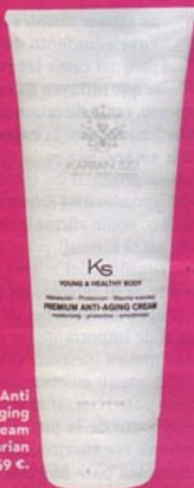
Anti Aging Cream de Karian Sei. 59 €.