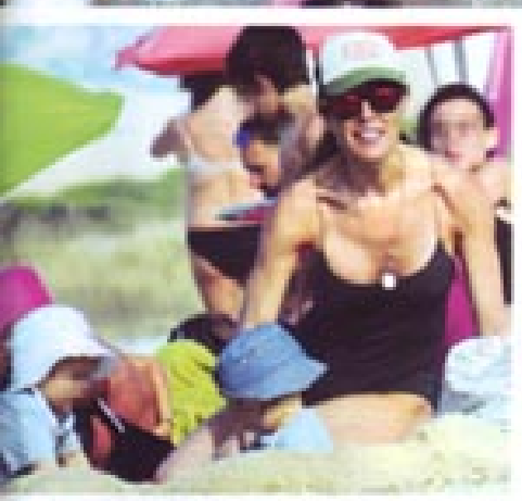
EXCLUSIVA RAQUEL SÁNCHEZ SILVA