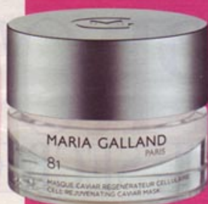
Mascarilla de caviar regenerante de Maria Galland. 83 €.